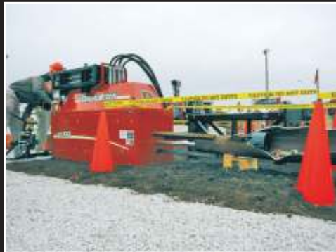
BORU HATTI YENİLEME SİSTEMLERİ