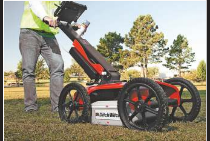
2450 GR JEORADAR