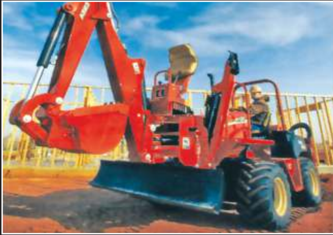
RT80 - Beko Ataşmanlı