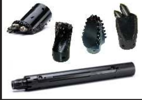
TRIHAWK KAZICI UÇLAR