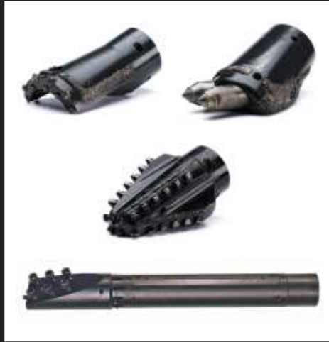
TRIHAWK KAZICI UÇLAR