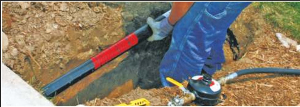
DELİK DELME EKİPMANLARI